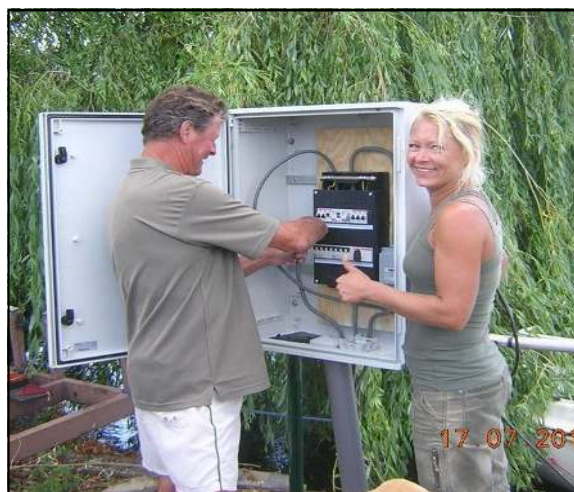
De nieuwe electriciteitskast