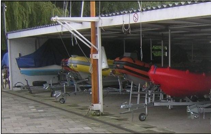
De gerestaureerde FD loods

Sinds ik mij heb verbonden aan de verantwoording voor het onderhoud van de gebouwen staat mijn naam ook vermeld onder het kopje bestuur. Ik hoop dat mijn inspanningen en werkzaamheden niet onopgemerkt zullen blijven, echter als bestuurslid zal ik onzichtbaar blijven, zeg maar een soort van lege stoel aan de bestuurstafel. Ik kreeg i.v.m. mijn vermeende bestuursvermelding wel een e-mail van de fam. Bos om copy in te leveren voor de Zelflozer. Het was ook een soort van SOS over het voortbestaan van het clubblad, het is vaak heel gênant te zien hoe mensen teleurgesteld worden in hun vrijwilligers activiteiten, zodat ik in ieder geval ga proberen in samenwerking met onze charman- te havenmeester een bijdrage te leveren aan het clubblad. Wat ons betreft is er genoeg te melden.