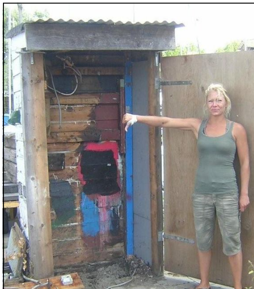
De oude electriciteitskast