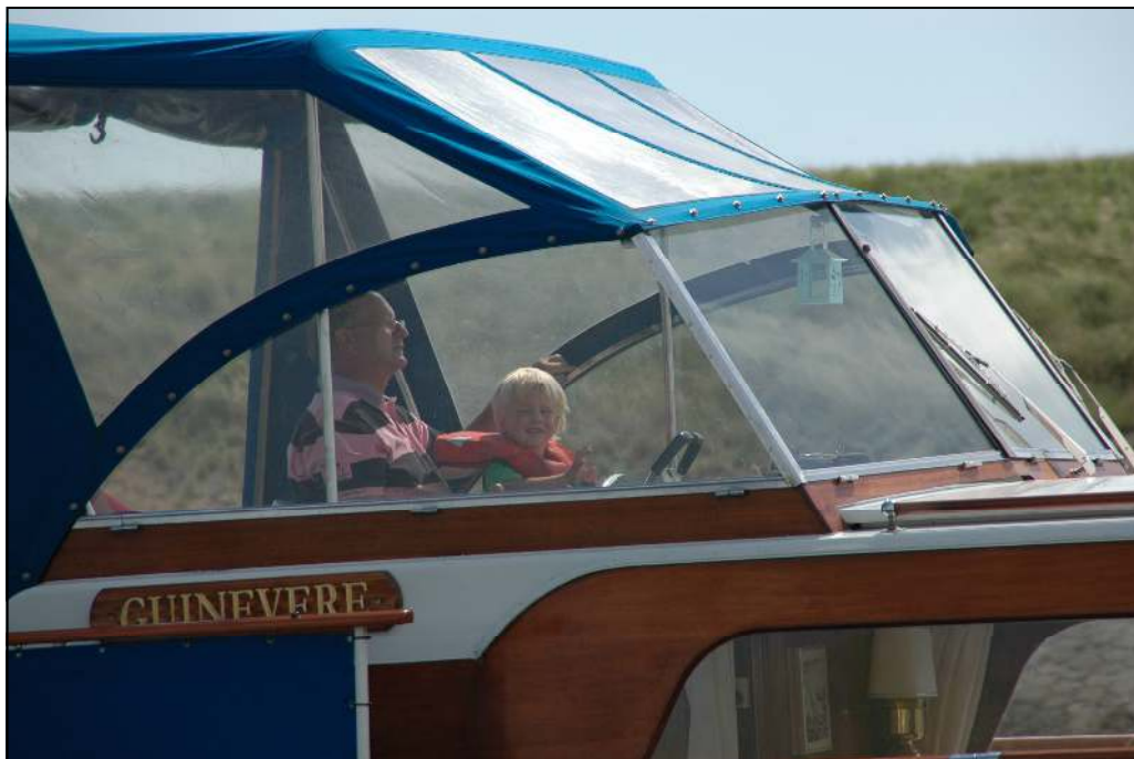
Carel met zijn kleinzoon Duuk aan het roer